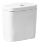
Cisterna de doble descarga 6/3L con alimentación inferior para inodoro